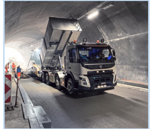
Schlitzrinnen, Randsteine und Siphonschächte T5 Bözingenfeld