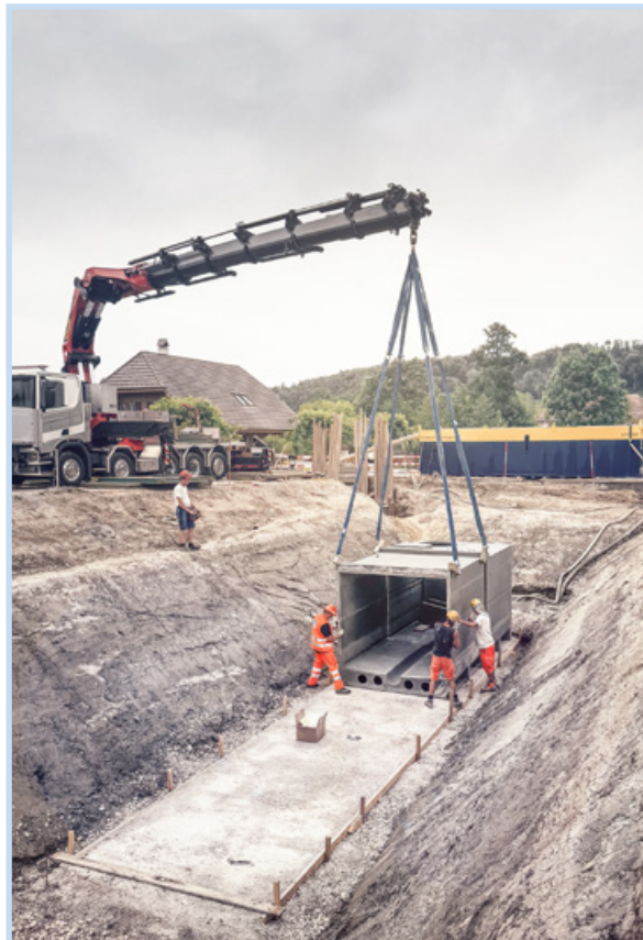
vorfabrizierter Mischwasserkanal, Diessbach