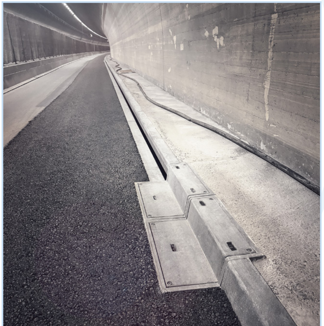
Schlitzrinnen, Randsteine und Siphonschächte Tunnel Bad Zurzach