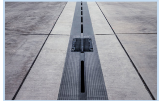
Anti-Rutsch Oberfläche auf Schwerlastrinne mit integriertem Spülelement