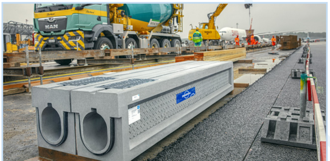
FORCEDRAIN-Airport Entwässerungsrinnen am Flughafen Zürich

Erfahrungsgemäss ist der Anschluss einer Rinne an den Entwässerungsschacht schwierig und daher oftmals Ursache von Problemen. Geeignete Übergangsstücke, respektive die Vorbereitung in den Schächten, eliminieren dies. Die Festigkeit von zeroUltra one erlaubt nun die direkte Integration von Spülöffnungen und Abläufen in die Entwässerungsrinne.