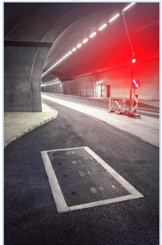
Verbundwerkstoff Schachtdeckungen Bad Zurzach