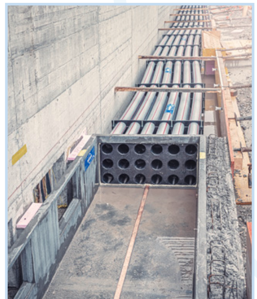
Kabelschacht Einhausung Schwamendingen