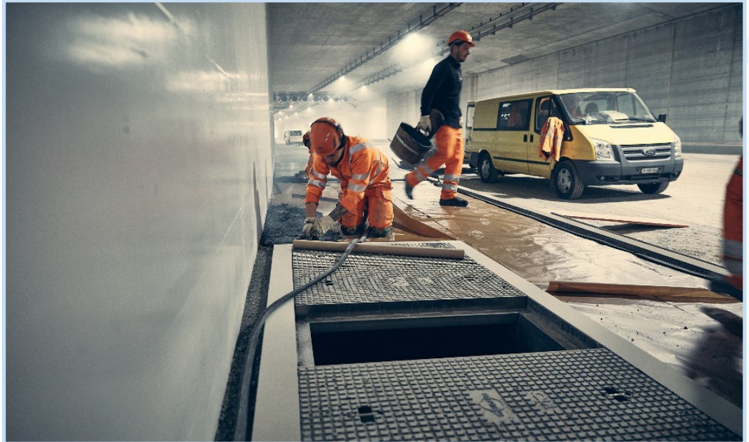
Einbau eines Kabelzugschachtes mit Verbundwerkstoff in der Einhausung Schwamendingen

Schacht-, Flächen-, und Stufenabdeckungen wurden bisher häufig aus Gusseisen, Beton oder Edelstahl bestellt und eingebaut. Unsere Schachtdeckungen aus Verbundwerkstoff nach EN124-5 werden heute auf Wunsch der Unterhaltsdienste in allen neuen Autobahntunneln und auf Autobahnen verwendet. In Kombination mit Rahmen aus UHFB entstehen auch hier neuartige Möglichkeiten, sodass oft auf zusätzliche Rahmenkonstruktionen verzichtet werden kann. Das geringe SUVA-zulässige Gewicht ermöglicht den Unterhaltsdienst und die Wartung der sonst teilweise über 100 kg schweren Deckel ohne Kran. Die Schachtdeckungen aus Verbundwerkstoff sind chemisch beständig, korrosionsfrei und lassen sich auch nach Jahren noch mühelos und ohne schweres Gerät öffnen. Und sie sind nicht elektrisch leitend. Ein grosses Plus in Sachen Arbeitssicherheit.