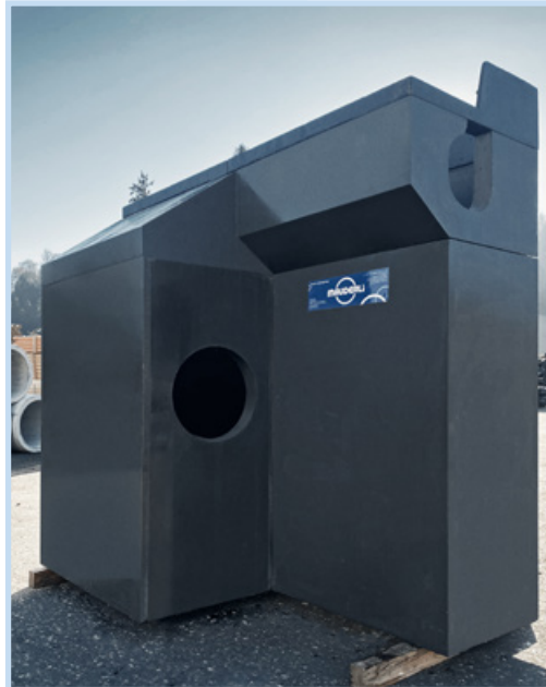
Siphonschacht Einhausung Schwamendingen. Einlauf Schlitzrinne (oben rechts) und Hauptentwässerungsöffnung unten.

Für eine durchgehende Systemlösung werden passende monolithische Einlauf- und Siphonschächte in UHFB hergestellt. Die Anschlüsse an das Entwässerungssystem werden dabei direkt in die Schächte eingelegt. Ein nachträgliches, qualitativ meist minderwertiges, Verfüllen und Abdichten von Öffnungen entfällt. Das Verlegen wird schneller und einfacher.