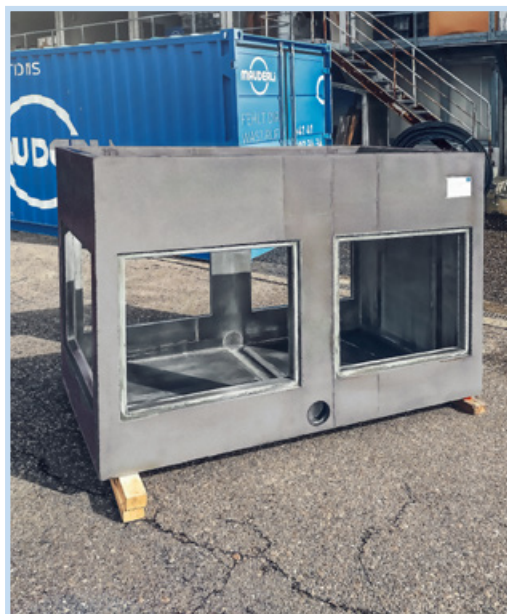
ASTRA A2 Kabelschacht

Verwendet man UHFB, können Kabelschächte nach ASTRA Norm (A1, A2, A3, S2, S3) oder auf Mass mit dünnen Wandstärken produziert werden. Die Gewichtseinsparung begünstigt eine vereinfachte Logistik, und die vorgefertigten auf Kundenwunsch gestalteten Anschlüsse erlauben ein schnelleres Verlegen. Das beschleunigt den Bauablauf. Mit geeigneten Detaillösungen können wir auf Anliegen der Betriebe eingehen, beispielsweise durch eine integrierte Entwässerung.