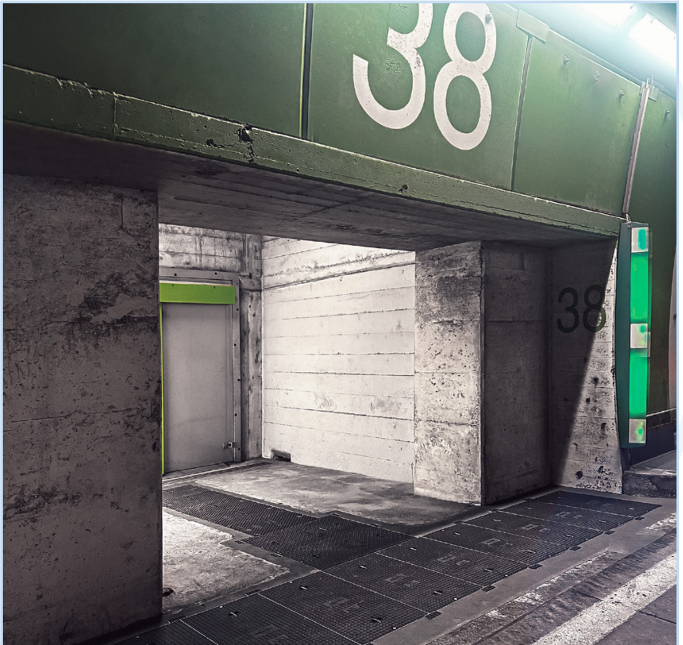
Massanfertigung Schachtabdeckung Verbundwerkstoff, Seelisbergtunnel