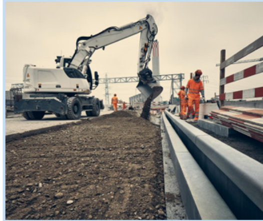
Einbau und Hinterfüllung von Schlitzrinnen im Projekt Einhausung Schwamendingen, 2023

MAUDERLI AG entwickelt und produziert mehrere Schlitzrinnen-Typen. Die Erfahrung zeigt: Hergestellt aus UHFB können diese bei gleicher Belastungsklasse mit deutlich dünneren Wandstärken hergestellt werden als Rinnen aus Polymerbeton. Dies ergibt gleiche Abflussvolumen bei kleinerer Geometrie. Die duktilen Eigenschaften von UHFB machen die Rinnen zudem deutlich weniger anfällig gegen Beschädigungen beim Handling, beim Einbau auf der Baustelle, während des Betriebs oder bei Belagssanierungen.