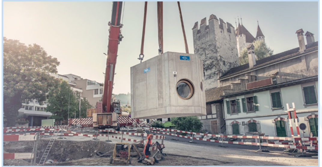
Mischwasserschacht Berntorplatz Thun

MAUDERLI hat sich einen Namen gemacht beim Bau von Schachtbauwerken – von Standard-Entwässerungsschächten bis hin zu sehr grossen Schächten als Variante zu Ortbetonlösungen. Unsere Betonschachtböden mit voll einbetonierten Kunststoffgerinnen kombinieren die Vorteile von Kunststoff und Beton. Kunststoff ist beständig gegen aggressive Abwässer. In Verbindung mit qualitativ hochwertigen Betonelementen ist die Qualität der Schächte – die Beständigkeit, Dichtigkeit und Lebensdauer – heute um ein Vielfaches grösser als früher. Werden solche Schächte in UHFB hergestellt, können vorfabrizierte Schächte in Dimensionen produziert werden, die bisher nur als Ortbeton-Variante möglich waren. Das erleichtert das Handling deutlich und beschleunigt die Einbauleistung. Ausserdem haben UHFB-Schächte einen signifikant längeren Lebenszyklus.