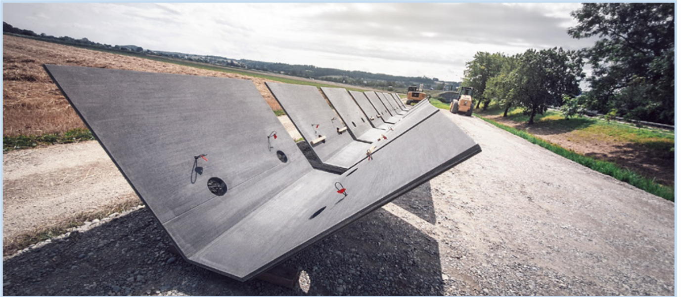
vorfabrizierte Bachelemente, Sanierung Aarmattenkanal Grenchen