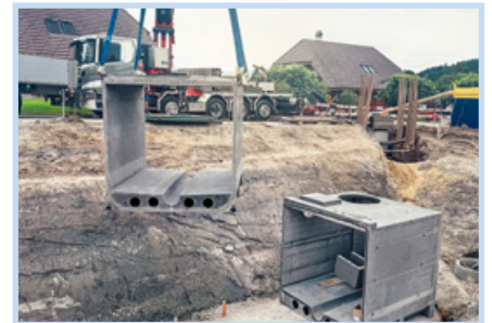
vorfabrizierter Mischwasserkanal, Diessbach