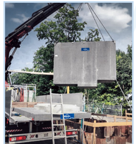
vorfabrizierter Pumpschacht, Bottmingen