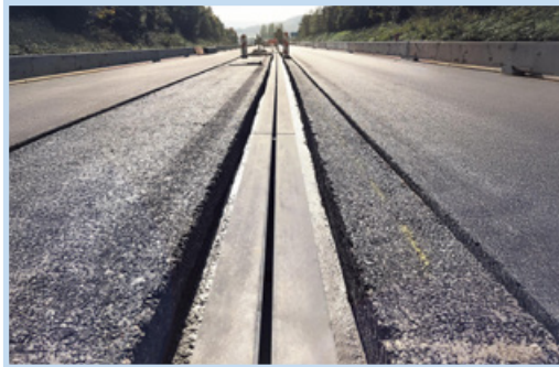
Schwerlastrinne F900 ohne Steg/Querrippe auf der Autobahn Yverdon

Auf Wunsch diverser Gebietseinheiten entwickeln und produzieren wir mehrere Schwerlastrinnen-Typen die ohne Querrippen oder Stege als Verstärkung auskommen. Sie gewährleisten während der ganzen Lebensdauer ein unterbruchfreies Spülen im Betrieb. Monolithischer Kantenschutz aus UHFB macht den bis heute zusätzlich eingesetzten Kantenschutz aus Edelstahl überflüssig und dank des geringen Gewichtes ist das sichere Verlegen mit kleinen Baumaschinen bei engen Platzverhältnissen möglich. Im Bestreben, die Sicherheit im Verkehr zu erhöhen, hat MAUDERLI Anti-Rutsch-Oberflächen entwickelt und von der IMP Bautech AG prüfen lassen. Sie sind abriebfest und reduzieren die Ausrutschgefahr auf den Schlitzrinnen, Schachtabdeckungen und Umrandungen bei Spurwechseln erheblich.